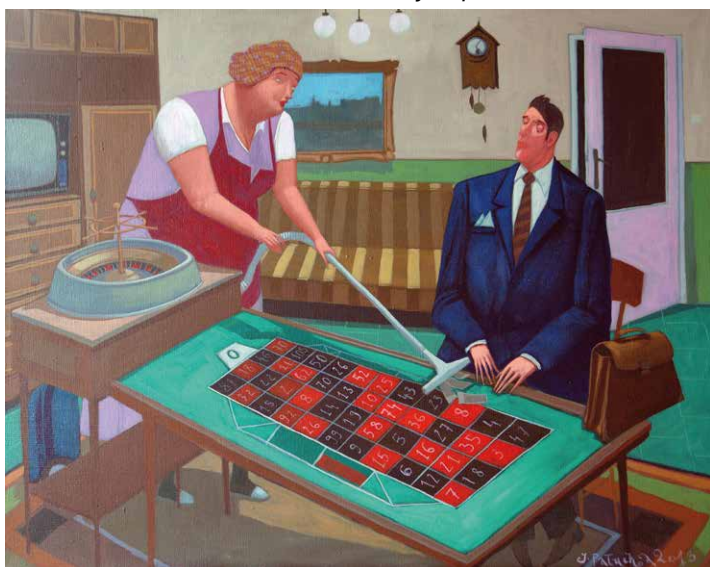
Casino Poland, olej na płótnie, 65x81 cm, 2013