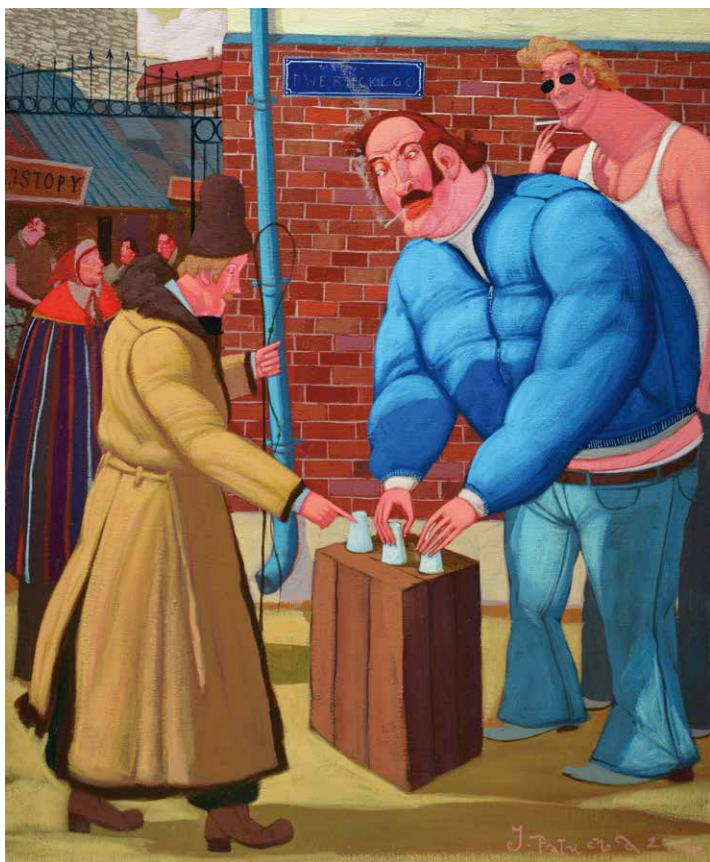
Trzy kubki, olej na płótnie, 55x46 cm, 2010